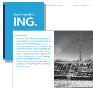
Broschüre Kein Ding ohne ING.

Der Postkartenblock zeigt eine Motivauswahl der Broschüre – fertig zum Verschicken.