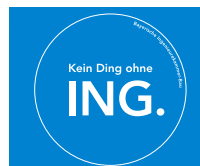
Aufkleber rund Kein Ding ohne ING.

13 Postkarten als Block mit verschiedenen Motiven der Kampagne Maße A6 (10,5 x 14,8 cm) Kosten kostenlos (max. 10 St.) Bestellnr. 02