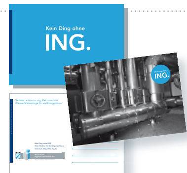
Postkartenblock Kein Ding ohne ING.

Maße A6 (10,5 x 14,8 cm) Umfang 52 Seiten Kosten kostenlos (max. 10 St.) Bestellnr. 01